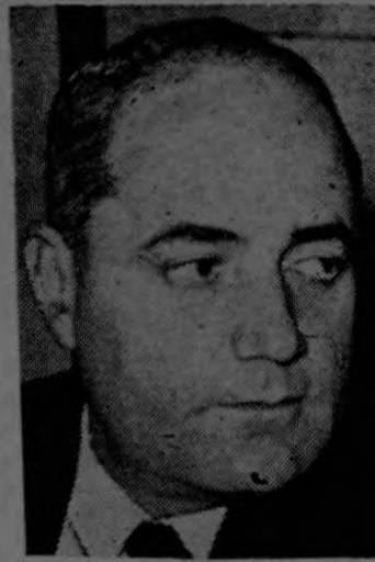
Presidente Mario Echandi

Arthur Bottmley, representante laborista en la Cámara de los Comunes, expresó que presentará la sugestión probablemente, al día siguiente de haberse terminado el receso del fin de año. El representante dijo que le solicitará a Macmillan que consulte con los primeros Ministros de Australia, India, Ceilán, Malasia y Nueva Guinea, sobre la conveniencia de conversar sobre la expansión del intercambio con el Asia. El representante observó que el Presidente Eisenhower había conversado con el Vice-Primer Ministro Mikoyan sobre temas referentes al comercio.