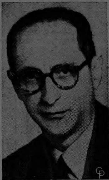
Presidente Arturo Frondizi

La partida del presidente se produce en los momentos en que está por producirse una definición entre el gobier-